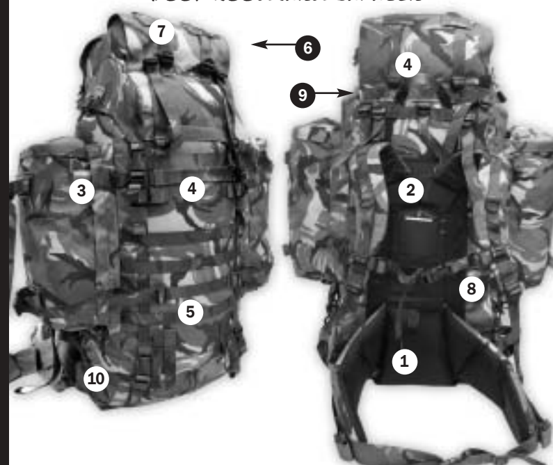
kenmerken van Rugzak Groot Woodland Saracen

De zijvakken zijn met een rits aan de rugzak bevestigd. Als er zware voorwerpen in de zijvakken worden gedragen, dienen de ritsen te worden geborgd d.m.v. de zijcompressiebanden, die zowel onder (door de knoopsgaten en door de banden aan de achterzijde van de zakken) als buitenom de zijvakken kunnen worden aangesnoerd. De zijvakken kunnen worden afgenomen, aan elkaar geritst en als kleine rugzak (patrol pack) worden gedragen.