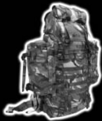
Rugzak Groot Woodland Saracen HANDLEIDING